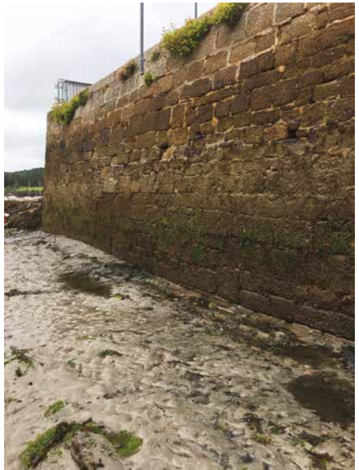
MUR POIDS TERMINE