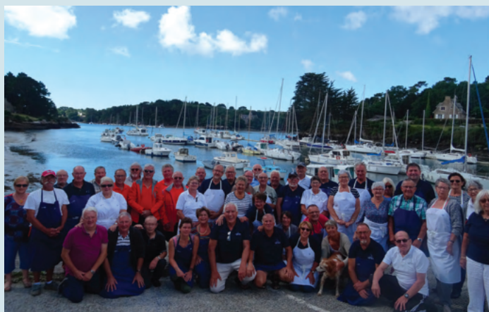
Une belle rencontre en perspective placée sous le signe de la bonne humeur et de la convivialité.

Ambiance assurée par les animations musicales et chants de marins des groupes « Belaven », « Les Gabiers du Passage » ainsi que les accordéons diatoniques de « Belon Diato ».