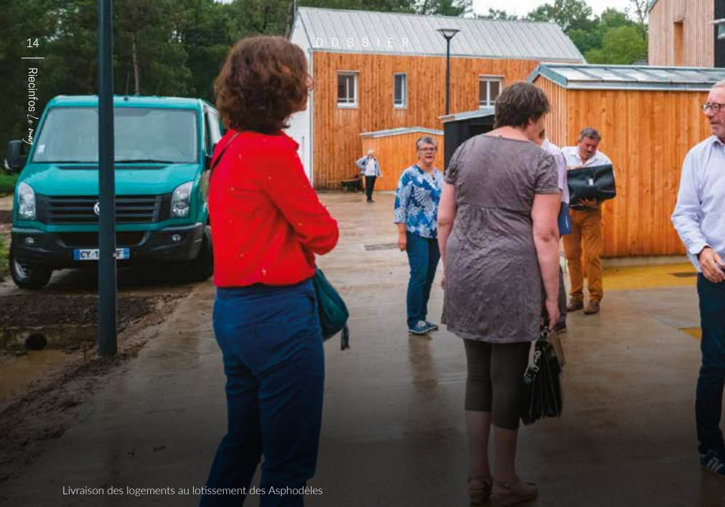
Livraison des logements au lotissement des Asphodèles

Ces différents projets d'habitat collectif sont d'autant plus porteurs qu'ils répondent aux exigences de densification des centres bourg et de réduction de la consommation des terrains agricoles. Densifier intelligemment en proposant des espaces de vie porteurs pour le commerce et la vie locale, et permettant à la population âgée de la commune de disposer d'une offre de logement favorisant le maintien au domicile est un point essentiel du développement des communes de demain.