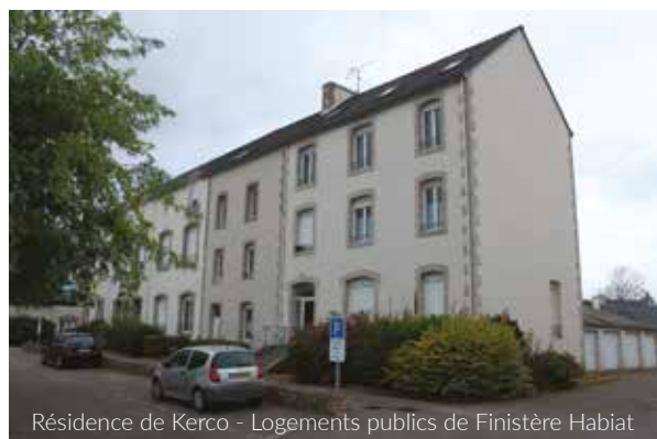
Résidence de Kerco - Logements publics de Finistère Habiat

Cette bâtisse du cœur de bourg, située en proximité directe des commerces et des services est un cadre idéal pour proposer de l'habitat collectif à destination des seniors. L'offre vers les seniors aura également