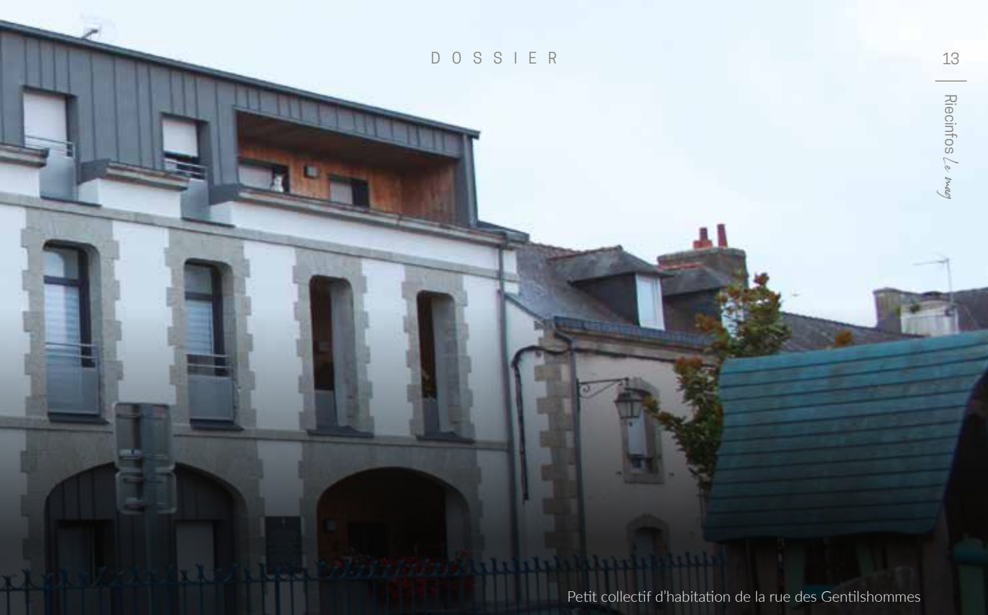
Petit collectif d'habitation de la rue des Gentilshommes