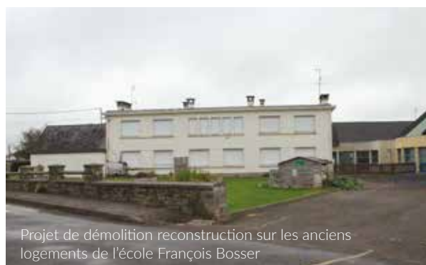
Projet de démolition reconstruction sur les anciens logements de l'école François Bosser

des conséquences positives sur le logement des familles en permettant de libérer des logements de grande taille souvent inadaptés au vieillissement, mais recherchés par les ménages avec enfants.